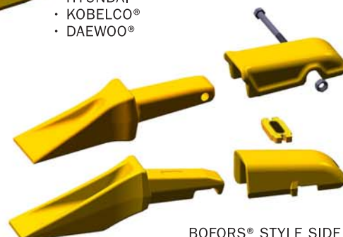
BOFORS® STYLE SIDE PIN, VERTICAL PIN & B-LOCK® STYLE TIPS & ADAPTERS