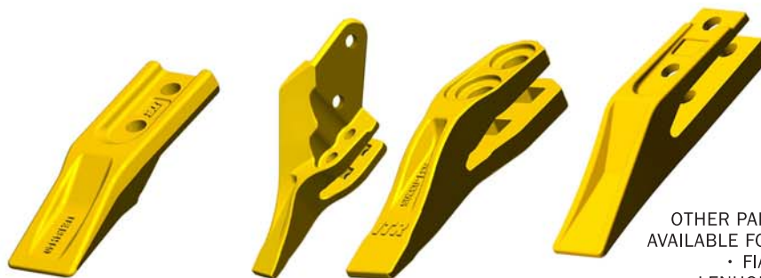
MINI Z® MONOBLOCKS