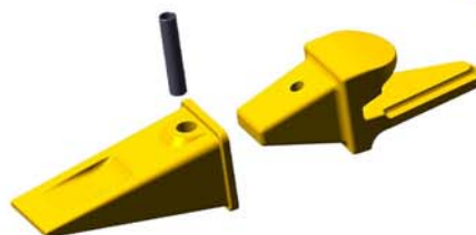
UNIZ® STYLE VERTICAL PINS TIPS & ADAPTERS

SIDE PINTIPS & ADAPTERS • CAT® JSERIES STYLE • KOMATSU® • HYUNDAI® • KOBELCO® • DAEWOO®